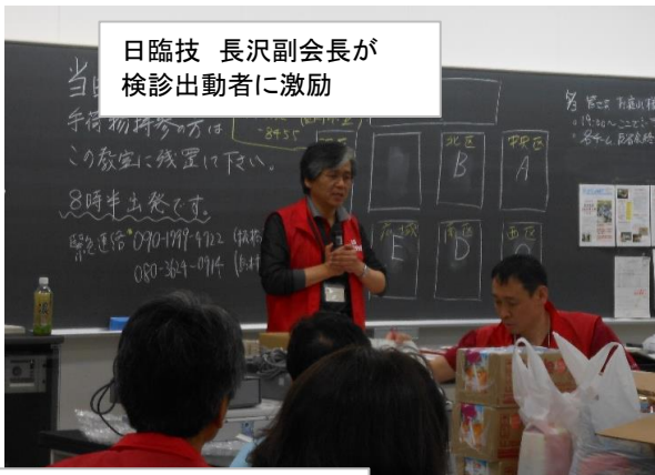
日臨技 長沢副会長が検診出動者に激励