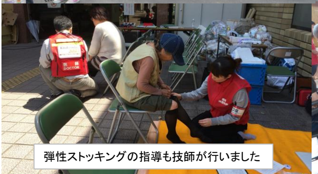
弾性ストッキングの指導も技師が行いました