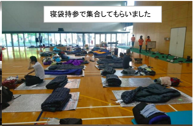
寝袋持参で集合してもらいました