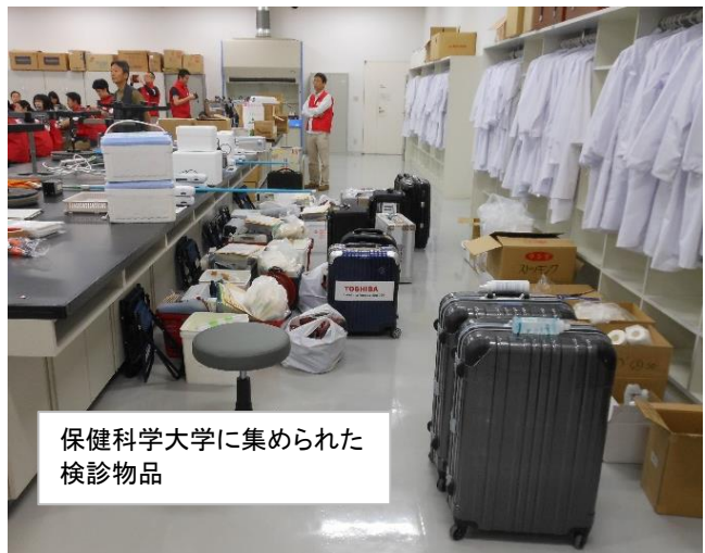
保健科学大学に集められた検診物品