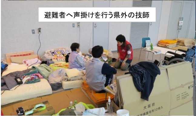
避難者へ声掛けを行う県外の技師