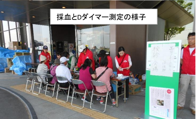
採血とDダイマー測定の様子