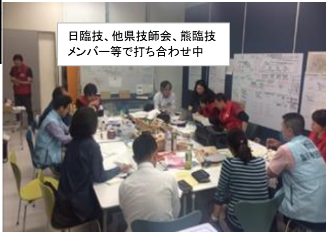
日臨技、他県技師会、熊臨技メンバー等で打ち合わせ中