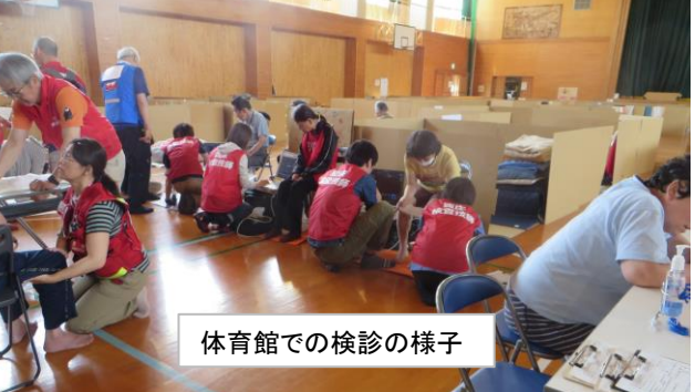
体育館での検診の様子