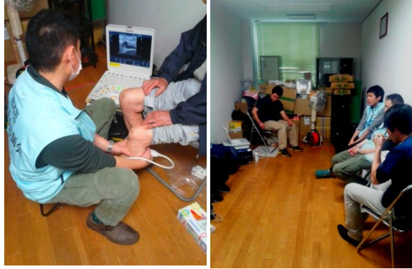
小学校の空き倉庫で検診