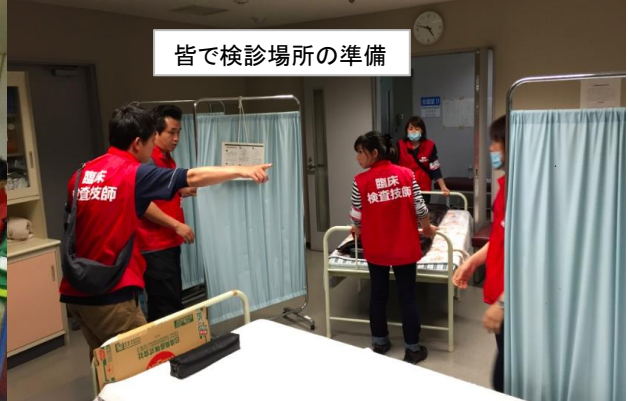
皆で検診場所の準備