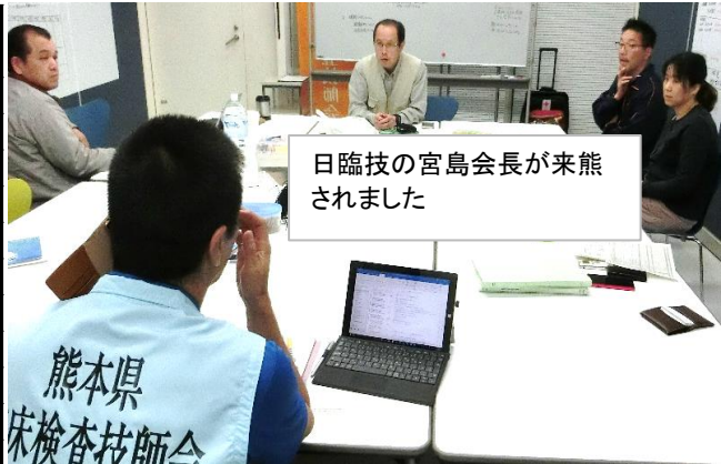
日臨技の宮島会長が来熊されました