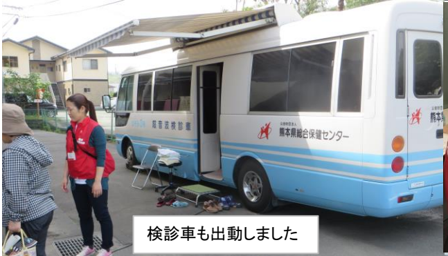
検診車も出動しました