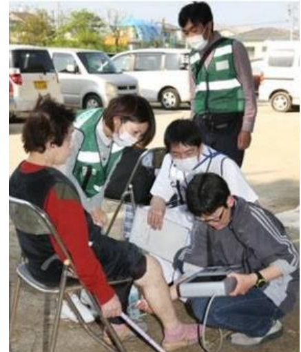
4月19日、初めての検診出動