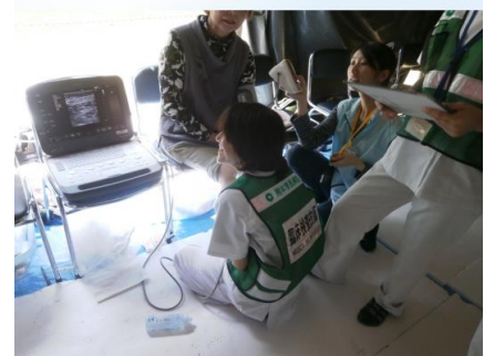
エコーと血圧測定を同時に行い時間短縮