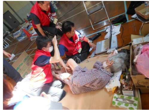
休まっている横に機器を持ち込んで