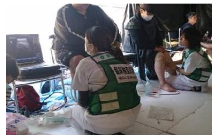
明るい場所でのエコー検査に苦戦