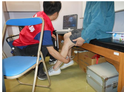
保健室を利用して