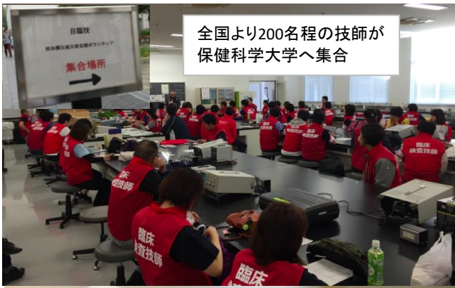
全国より200名程の技師が保健科学大学へ集合