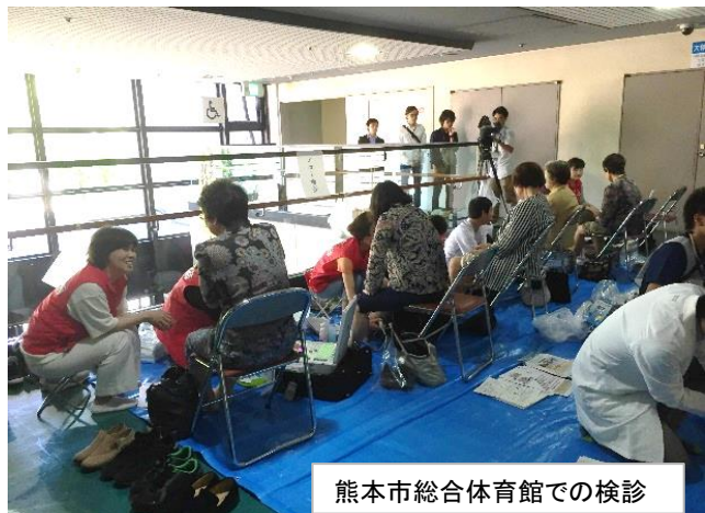
熊本市総合体育館での検診