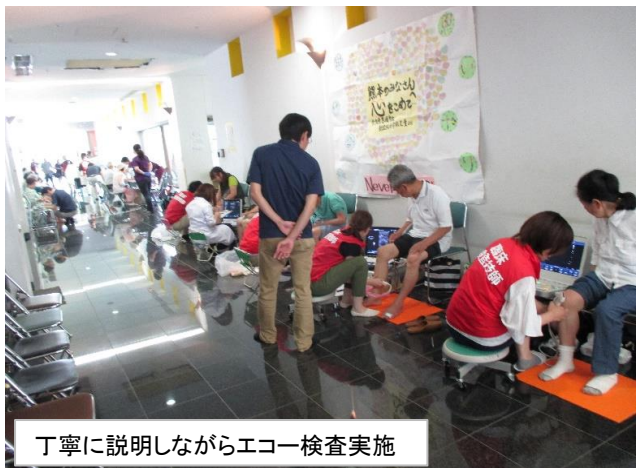
丁寧に説明しながらエコー検査実施