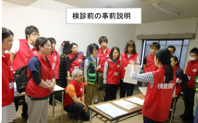
検診前の事前説明