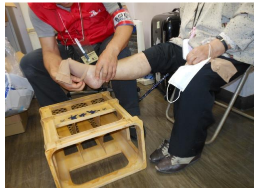
ストッキング装着指導 身近な台を使って