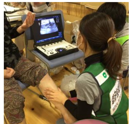
当初は無理な姿勢で検査を行うことも