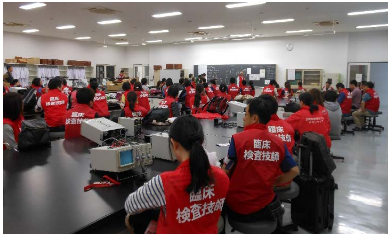
がまだせ！熊本ブルドーザー作戦 ミーティング風景

昨年4月の熊本地震発生から間もなく1年を迎えようとしています。私たち熊本県臨床検査技師会は全国からボランティアとして参加いただいた検査技師の皆様と共に発災直後よりエコノミークラス症候群予防啓発の為にDVT検診を行ってきました。1年目の節目を迎えるにあたり、今までの活動の記録をまとめましたのでここに報告致します。